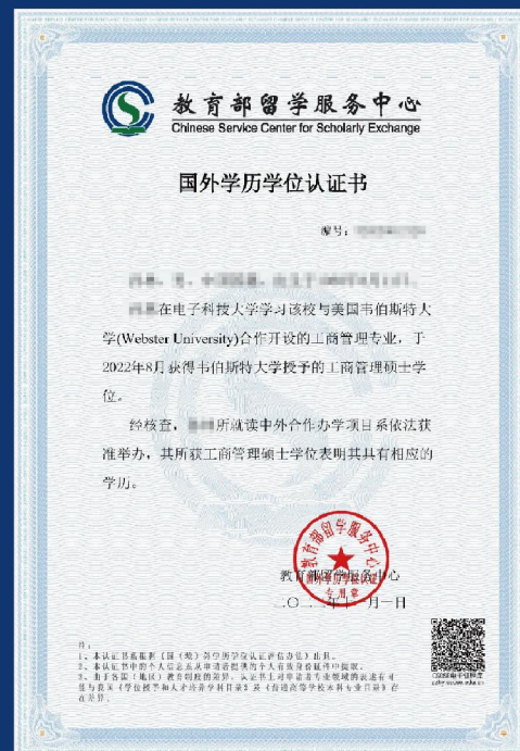
教育部留学服务中心国外学历学位认证证书样本